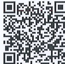
過往六福永續獎影片